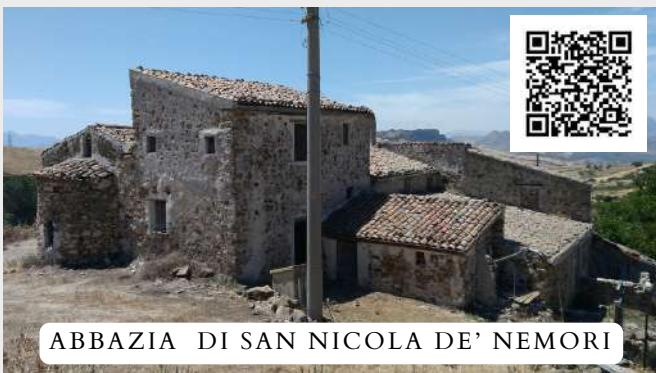
ABBAZIA DI SAN NICOLA DE' NEMORI