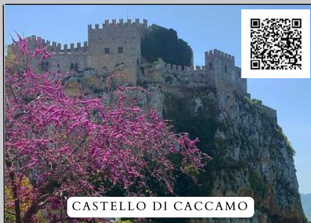
CASTELLO DI CACCAMO

Trek di un giorno sui passi del Beato Guglielmo Gnoffi, dal Castello medievale di Caccamo, scendendo verso la valle del fiume San Leonardo e infine risalendo fino all'Eremo San Felice (da lui edificato attorno al 1300), all'interno della R.N.O. di Pizzo Cane, Pizzo Trigna e Grotta Mazzamuto.