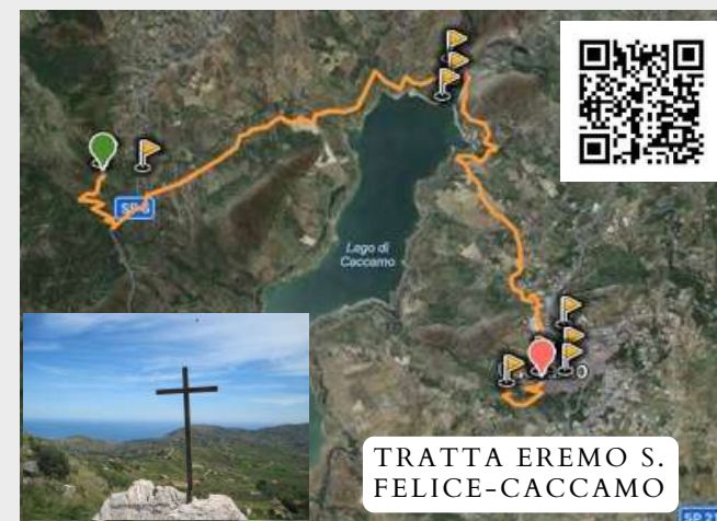
TRATTA EREMO S. FELICE-CACCAMO