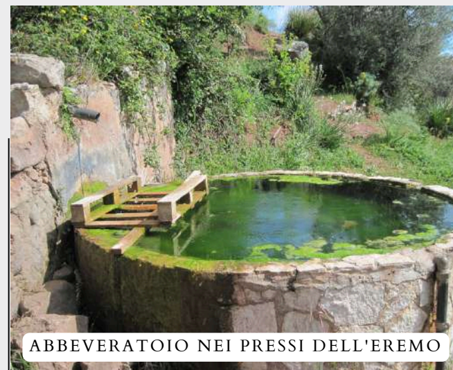
ABBEVERATOIO NEI PRESSI DELL'EREMO

La Via francigena Palermo-Messina è un percorso tra le montagne unico e continuo, di circa 390 km, che in 21 tappe unisce Palermo con Messina. Il territorio di Caccamo è attraversato da due tappe della Via Francigena: