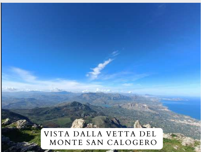
VISTA DALLA VETTA DEL MONTE SAN CALOGERO

Il Cammino di San Teotista è un trek di un giorno che ripercorre le orme di San Teotista, monaco basiliano vissuto nel IX° sec. d.C. e compatrono di Caccamo.